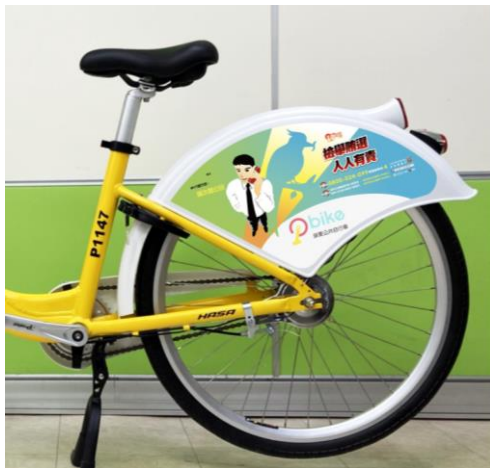
腳踏車後土除廣告模板